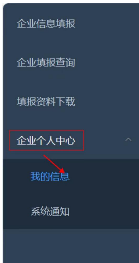
图 2-8 企业账号信息修改页面