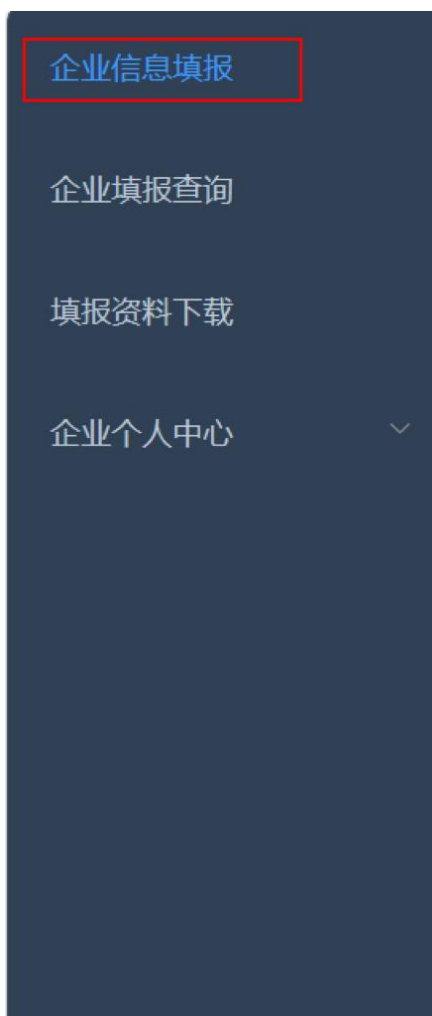
图 2-2 企业信息填报页面

点击左侧【企业信息填报】按钮，逐一填写“企业基本信息”“企业产品信息”。注意：企业基本信息和企业产品信息两项均填写完成后方可保存。