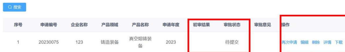
图 2-6 企业填报查询-列表页面

其中，初审结果指地方工信部门初审情况，分为初审通过、初审不通过两种情况。审批状态指材料提交状态及工信部的复审情况，分为未提交、已提交、复审通过、复审不通过四种状态。